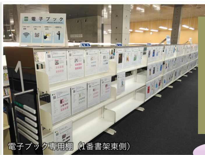
電子ブック専用棚 (1番書架東側)