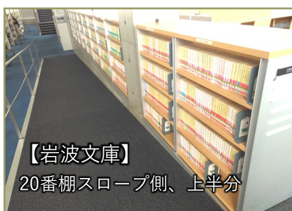
【岩波文庫】 20番棚スロープ側、上半分