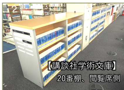
【講談社学術文庫】 20番棚、閲覧席側