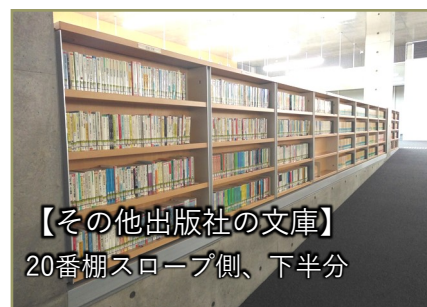
【その他出版社の文庫】 20番棚スロープ側、下半分